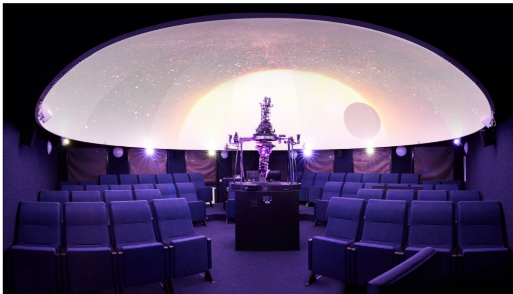
Hvězdný sál planetária Jazykového a komunikačního centra Gymnázia Cheb

Škola má také svoji vlastní hvězdárnu s dalekohledem řízeným počítačem. Hlavní zrcadlo dalekohledu má průměr 30 cm; v interiéru i exteriéru školy je rozmístěno množství názorných interaktivních exponátů, které vytváří malé science centrum.